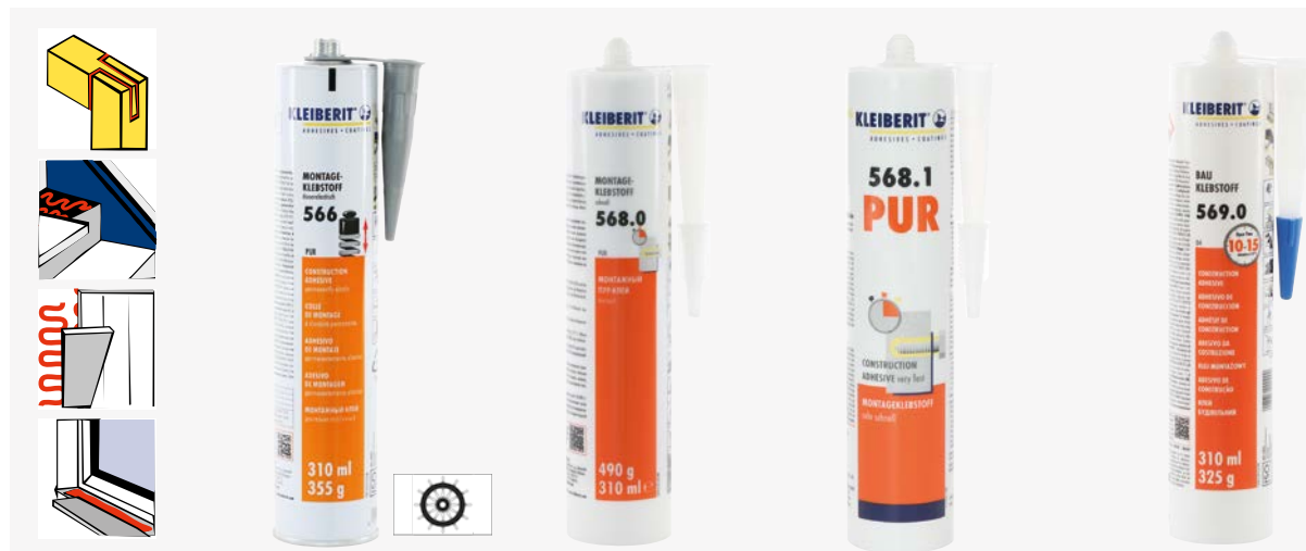
KLEIBERIT 566.0 DAUERELASTISCH UND UNIVERSELL