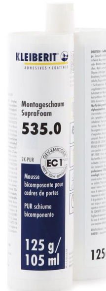
KLEIBERIT 535.0 SupraFoam in der Doppelkartusche